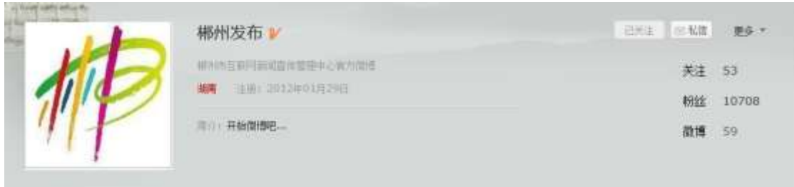
图 2-11：@郴州发布 微博回应城管砸死瓜贩事件