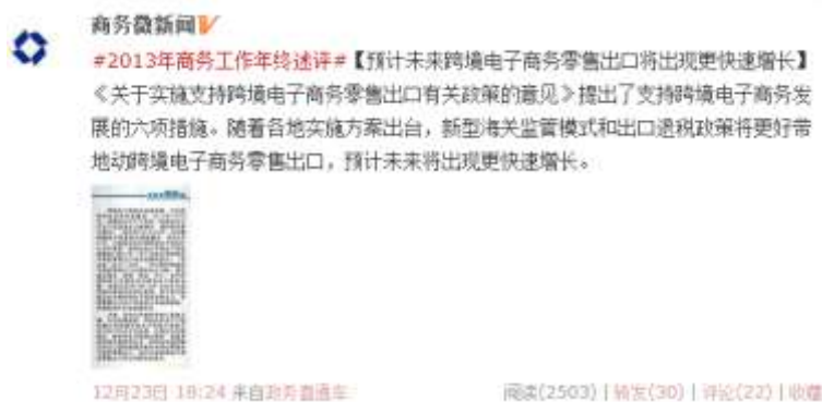
图 4-3：一篇微博要经过选题→编辑→作图→审核→送签→发布等多个环节。

据商务部官方微博@商务微新闻 负责人介绍，该官方账号每条微博都需要值班编辑报送部门领导之后，经过签发等严格程序之后才能发布。