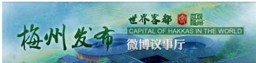
图 2-3：梅州发布微博议事厅人民微博平台页面