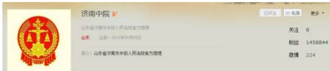
图 2-7：@济南中院 人民微博平台官方账号