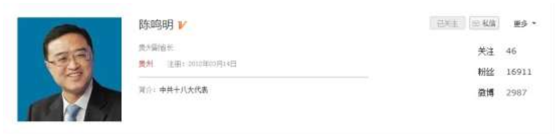
图 2-12 : @陈鸣明 通过人民微博平台官方账号回应争议