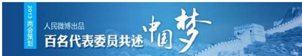
图 2-4：百名代表委员共述中国梦专题