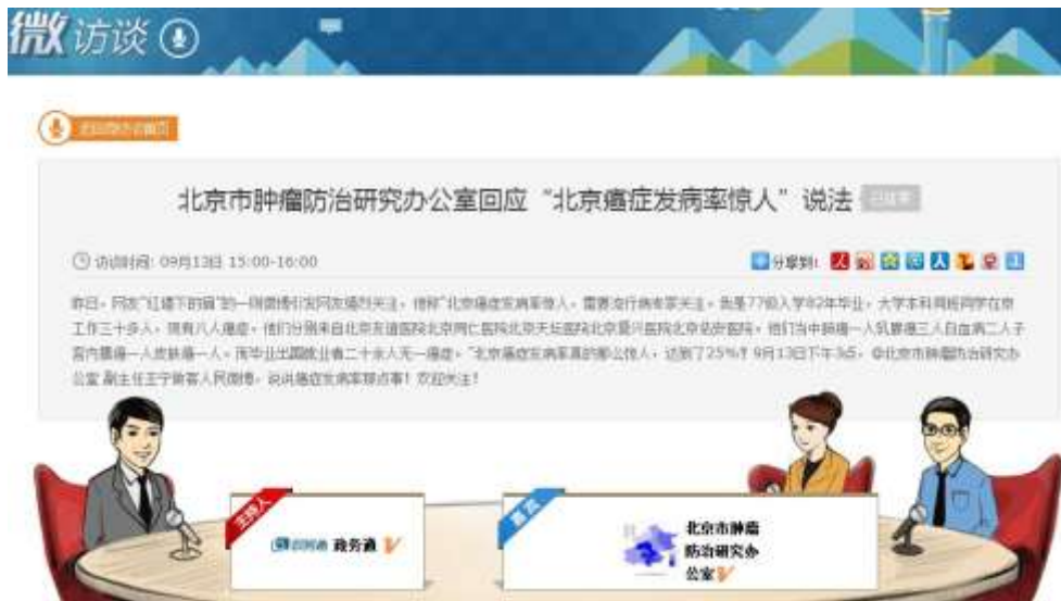
图 2-13：@北京市肿瘤防治研究办公室 回应雾霾致癌访谈