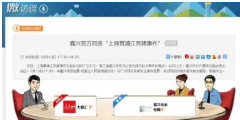
图 2-10：嘉兴官方回应上海黄浦江死猪事件访谈