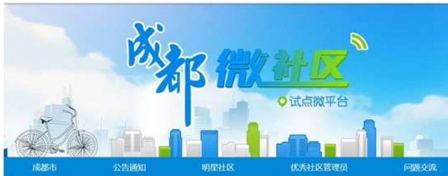
图 2-2：成都微社区人民微博平台页面