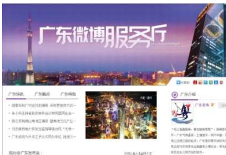
图 4-4：广东微博服务厅在集群新闻和服务方面都处于领先地位

2013 年，人民微博先后开通多家集群式微博发布厅，从省市级政府到共青团委，实现了政务微博常态化、平台化发声，既有利于网友们随时互动沟通、反映问题，也利于政务微博形成区域效应、规模效应，从而更有利于一些政务问题的快速解决。