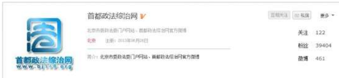
图 2-8：@首都政法综治网 人民微博平台官方账号