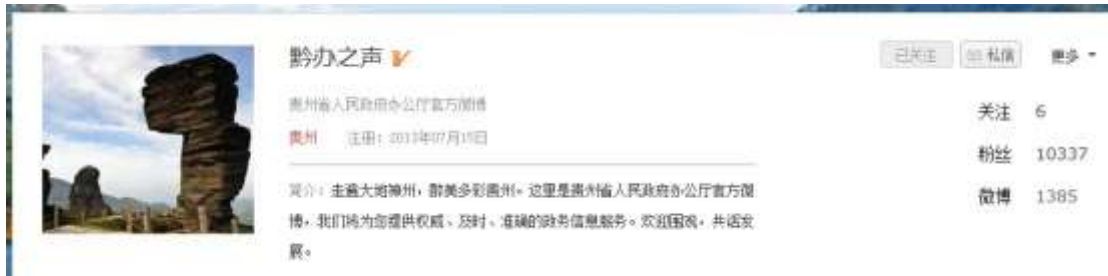
图 2-9：@黔办之声 人民微博平台官方账号