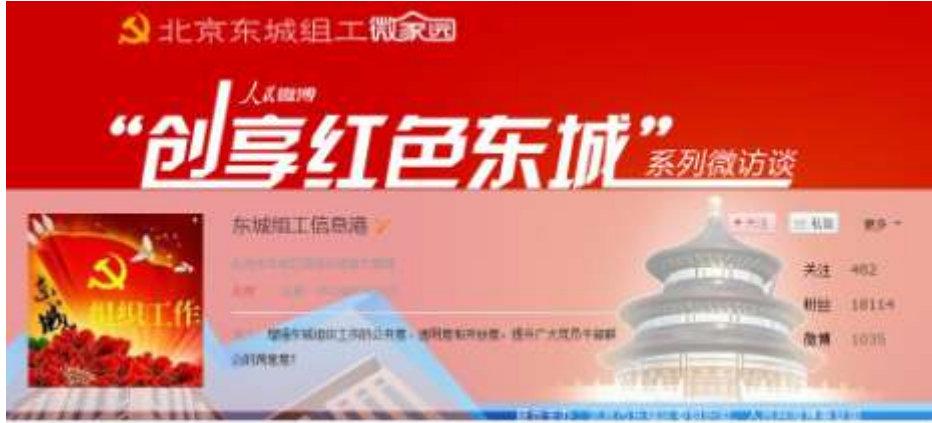
图 2-1：北京东城组工微家园人民微博平台页面