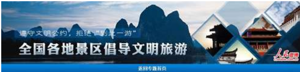
图 2-6：全国各地景区倡导文明旅游专题