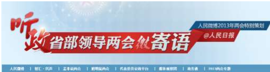
图 2-5：听政-省部领导两会微寄语专题